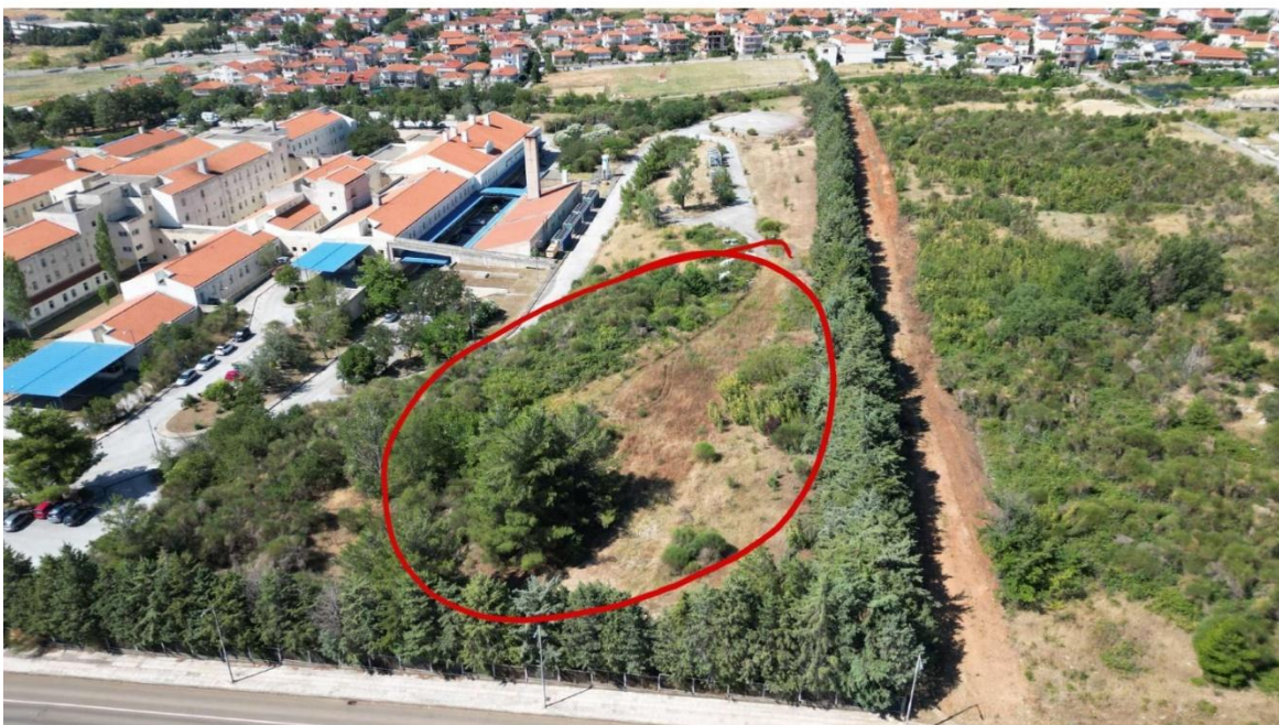
Εικόνα 2.: Καθαρισμός ΒΑ πλευράς από δέντρα και θάμνους

Η περιοχή καθαρισμού και απομάκρυνσης της καύσιμης ύλης φαίνεται στην παρακάτω εικόνα 2. Η περιοχή των 7.000 μ 2 είναι αυτή που σημειώνεται με κύκλο. Φαίνονται επίσης τα δέντρα της Βόρειας και Δυτικής πλευράς.